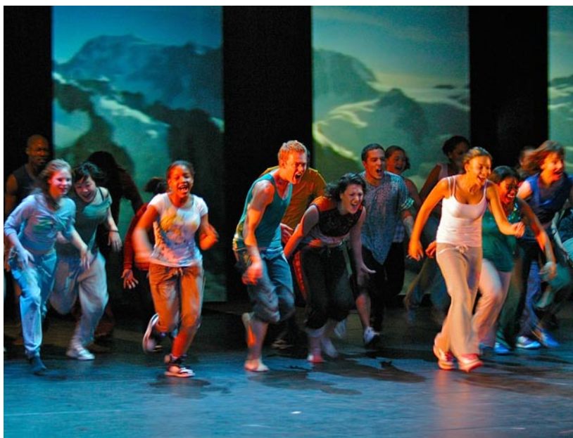
Jongeren van verschillende scholen uit Hoogeveen dansen samen met de professionele dansers van AYA.

Maakten ze zich geen zorgen over de kwaliteit van hun voorstelling? Van Leeuwen: "Ik was vooraf enigszins sceptisch, maar het viel ongelooflijk mee. Het scheelt natuurlijk dat de leerlingen min of meer zichzelf kunnen spelen, als vriend van Roos." Wentzel vult aan: "En als scènes niet helemaal goed uitpakken, kunnen we ze weglaten. Het gebeurt wel eens dat we kinderen tegen zichzelf in bescherming moeten nemen. Als ze teksten uitspreken, waar ze later misschien nog last mee