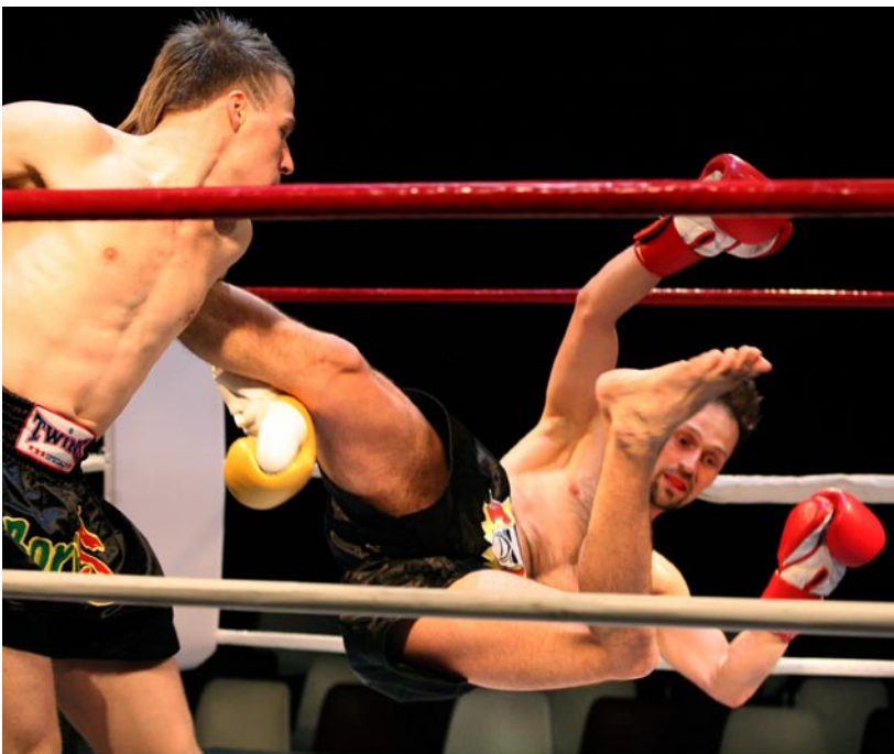
In de voorstelling Thaibox Verdriet vechten de spelers letterlijk en figuurlijk om een plaats in het bestaan.

Liesbeth Coltof, regisseur bij de Toneelmakerij