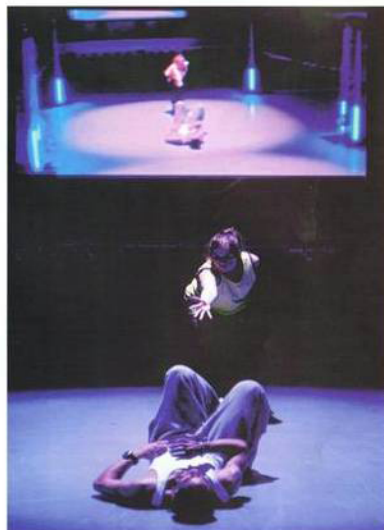
Strada, een unieke formule van Bekijk 't: snel, beeldrijk en associatief